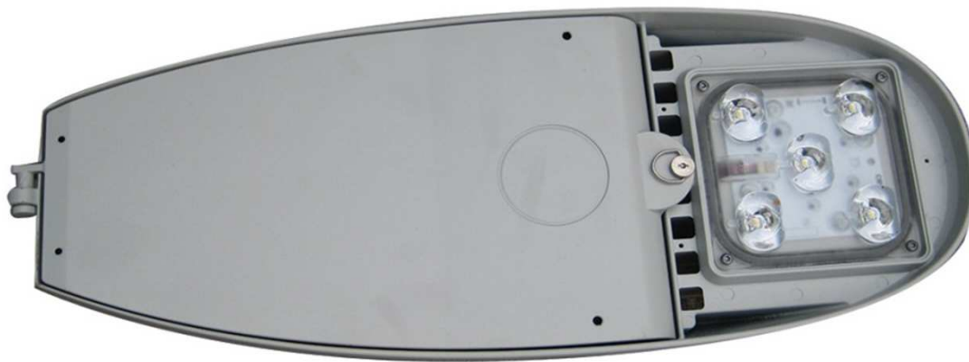
LEDS BI lighting